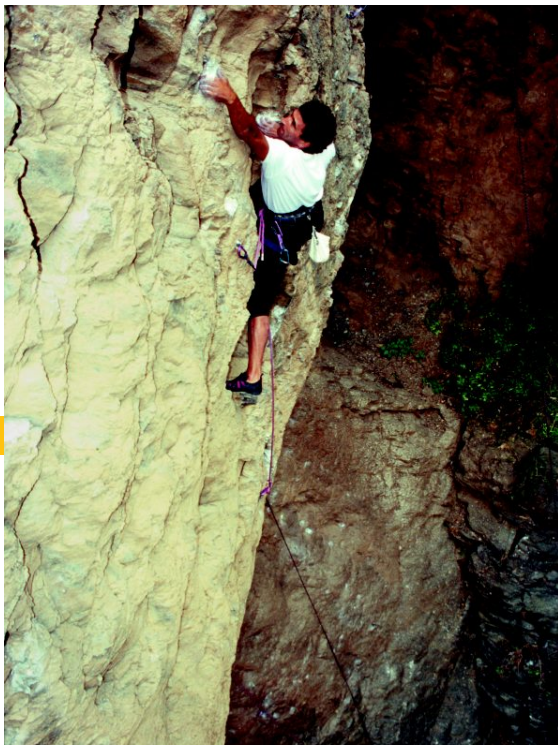
ran en la continua Asilvestrada 7a